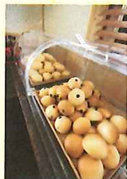
サクサクメロンパン、ミルクパンなど各50円(一部100円のものあり)。