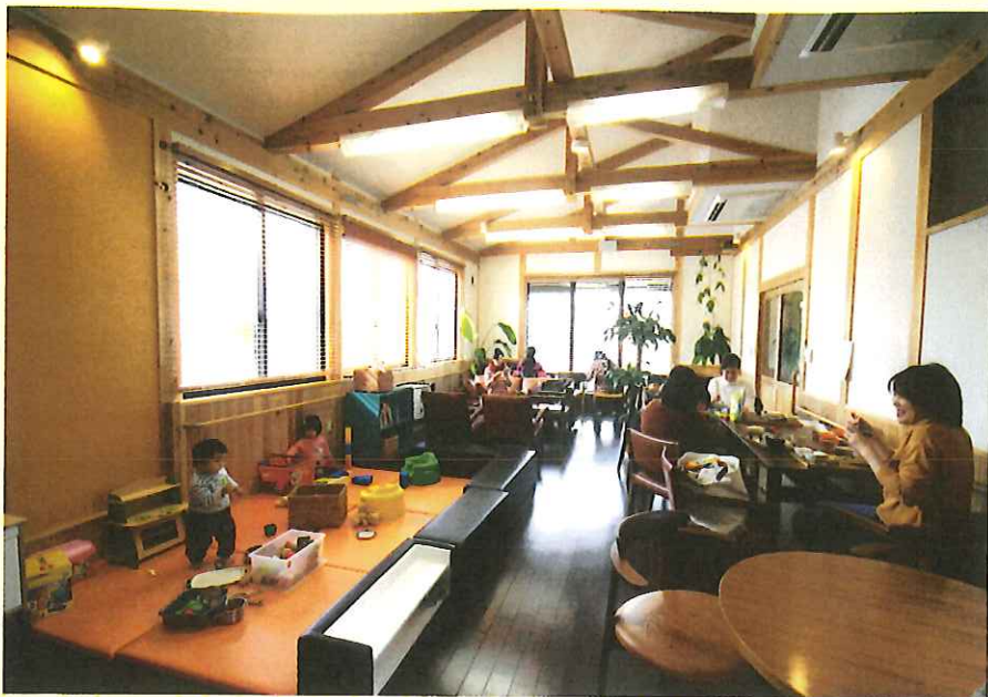
柔らかいマットが敷かれたキッズスペース。