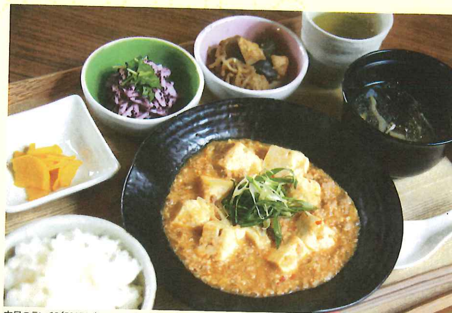
本日のランチB(500円/11:00～売切まで)。この日は麻婆豆腐、こんにゃくと竹輪の土佐煮、長芋のゆかり和え。ランチはAとBの2種あり。