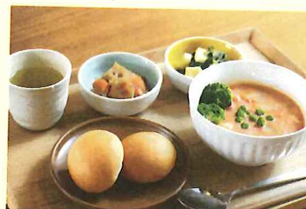
本日のAランチ(500円/11:00～売切まで)。取材時は月1回のパンの日。エビのトマトクリームシチューがメインでした。