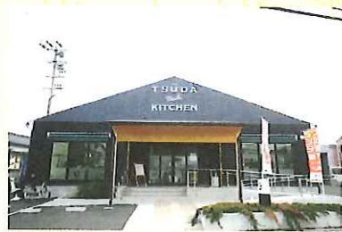
地域密着型のデイサービスセンター。パンやお味噌作り講座などを開催中。