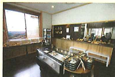
お弁当や惣菜が並ぶ販売スペース。