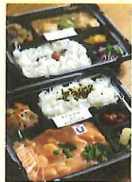
お弁当(400円)も日替わりでAとBを用意。値段は主菜によって変わる場合があります。